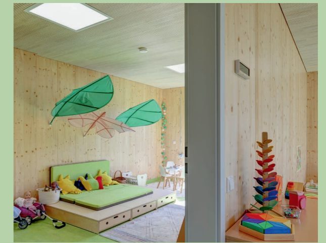
Neubau Kindergarten in Hochdorf