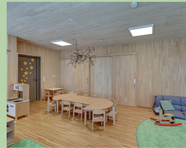
Neubau Kindergarten in Neuravensburg