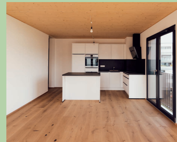
Neubau Wohnkomplex in Hegge