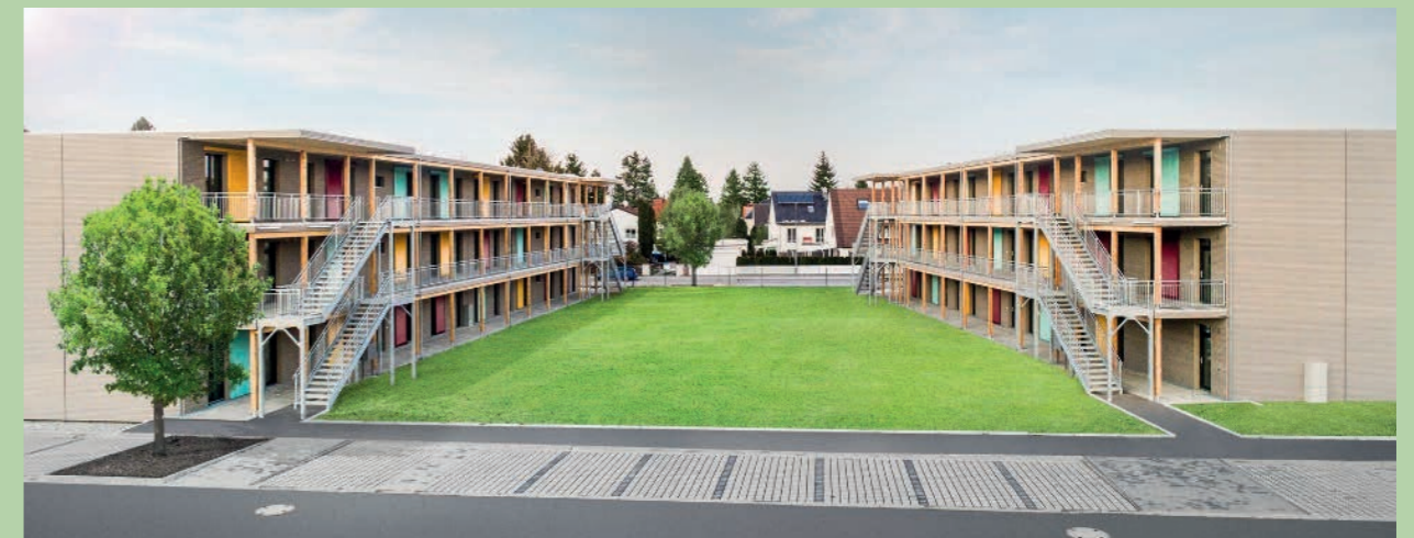
Neubau Wohnheim ‚Stiftsbogen‘ in München