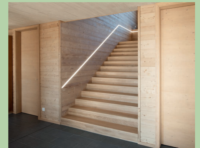
Neubau Bürogebäude in Herzmanns

Nachhaltig, innovativ, modular: So baut man heute!